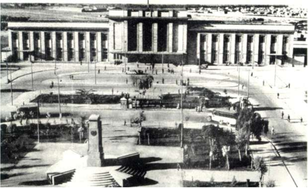
تصویر (23) - جلو خان ، نوعی خاص از میدان شهری