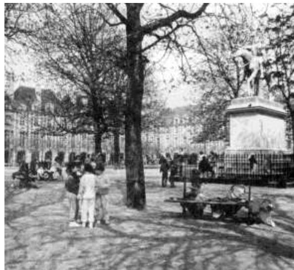
تصویر (20) - همجواری مسالمت آمیز انسان و طبیعت در میدان شهری

بخش اعظمی از نشاط میداین شهری به واسطه دلبازی آن می‌باشد. هر چند این دلبازی نباید حس محصوریت را مخدوش کند. هرچقدر که میدان وسیعتر و ارتفاعات اطراف آن کوتاهتر باشد، سهم آسمان به نوعی در صحنه میدان زیادتر و احساس دلبازی بیشتری بوجود می‌آید (البته همه