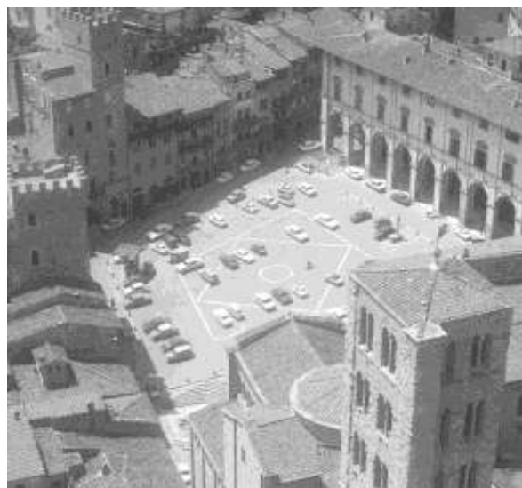
تصویر (13) - میدان یا پارکینگ عمومی؟