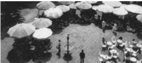
تصویر (21) - میدان شهری، فضای چند منظوره

از جمله نکات مهمی که در انعطاف میداین شهری مؤثر است، یکپارچگی فضای میدان است، (اینکه کف یکپارچه و پیوسته باشد و از خرد کردن آن با مبلمان، درخت و اختلاف سطح پرهیز کنیم).