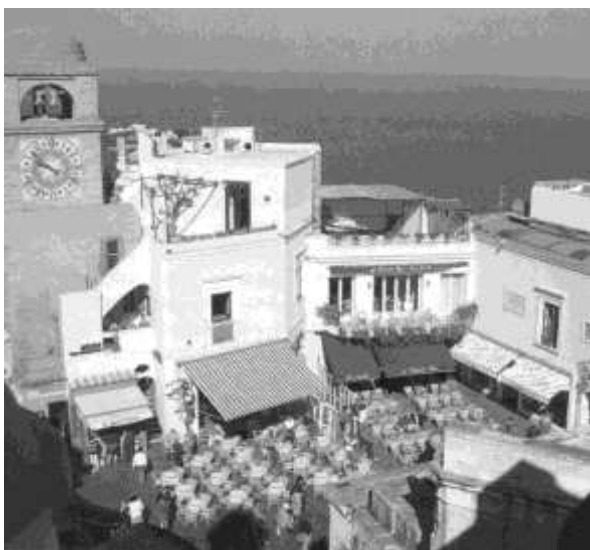
تصویر (17) - میدان، محل تجمع و تعامل

در مقابل، طراحی کالبدی فضا و عناصر مستقر در آن (مبلان و پوشش گیاهی) هرچه بیشتر به سمت هماهنگی و وحدت سوق پیدا کند تا توجه بیشتر معطوف به حیات داخل میدان شود تا جداره‌ها و عناصر فیزیکی آن. شاخص شدن عناصر کالبدی را زمانی می‌توانیم داشته باشیم که به یادآوری خاطرات جمعی فضا، حس مکان و تصویر ذهنی شهروندان کمک کند.