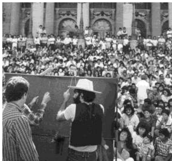
تصویر (16) - میدان محلی انواع نمایش‌های مردمی

با توجه به تصویر ذهنی شهروندان از میدانی شهری که فضایی پر جنب و جوش و پر از رویداد است، برای اینکه میدان شهری پاسخگوی توقعات ذهنی شهروندان باشد باید دارای زندگی و شور و هیجان باشد، فضایی سرزنده و با نشاط. این موضوع در ارتباط با بروز دو کیفیت اصلی رخ