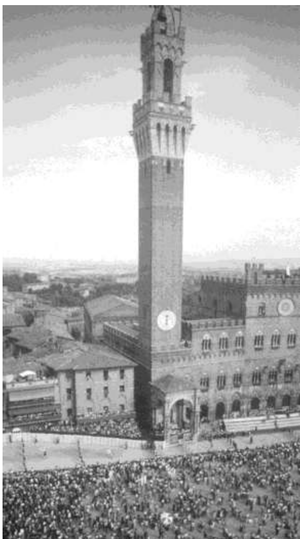
تصویر (15) - بنده تاریخی و خاطرات جمعی شهروندان

شکل، ابعاد و اندازه میدان نیز در تعریف‌شدگی فضای میدان شهری بسیار مؤثر است. باید توجه داشت که اندازه و ابعاد عناصر تعریف‌کننده میدان می‌بایستی برای ناظر قابل ادراک باشد. از طرفی فرم میدان نیز باید بالنسبه ساده باشد. چون که پیچیدگی و شکست زیاد در فرم میدان فضای آن را تکه‌تکه کرده و آن را به چند زیرفضا تقسیم می‌کند. در ضمن این فرم هرچه که به فرم‌های تمرکزگرا نزدیک‌تر باشد