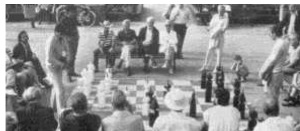
تصویر (12) - میدان امکان تعاملات اجتماعی

میدان شهری فضایی است که مخاطبین آن را طیف وسیعی از اقشار اجتماعی، گروههای سنی و... تشکیل می‌دهند. این فضا هم باید پذیرای این همه تنوع باشد و هم بتواند تجمع و