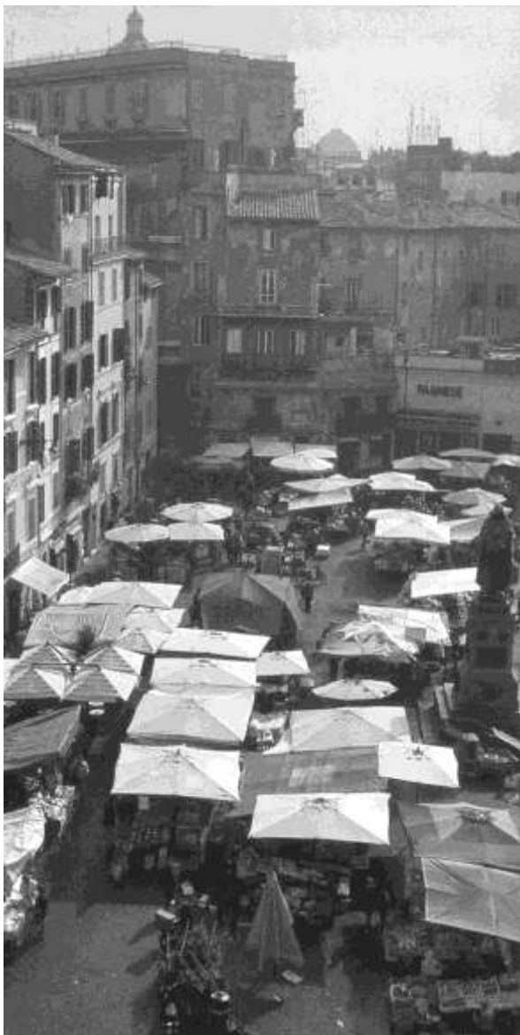
تصویر (19) میدان عرصه‌ای برای فعالیت‌های ممنوع

تداوم حضور شهروندان در داخل فضا مؤثرند. تنوع این قبیل کاربریها (رستوران، تریا، قهوه‌خانه و...)، تنوع در سطح سرویس از نظر قیمت برای جلب اقشار درآمدی مختلف، و همچنین در نحوه سرویس دادن، (سرویس‌دهی در داخل فضای میدان و نه فقط در درون رستوران)، در سرزندگی فضا بسیار مؤثر است. از طرف دیگر فعالیت‌های غیرمستمر در میدان به سرزندگی و نشاط آن کمک می‌کنند، فعالیت‌هایی همچون دستفروشی، بساطی، دوره‌گردی و معرکه‌گیری که حضور آنها همیشه همراه با صدا و تجمع گروه‌های کوچک شهروندان در اطراف آنهاست. اشیاء ریز و درشت رنگی بساط آنها، بعضاً بخار و بوی خوراکی‌های دستفروشان، حرکت و استقرارشان و نحوه اعلام حضورشان، ... همه و همه جزو