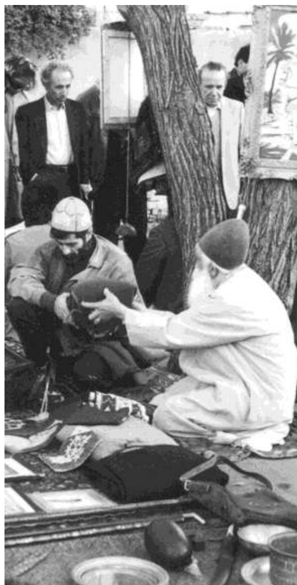
تصویر (18) میدان و فعالیت‌های غیررسمی