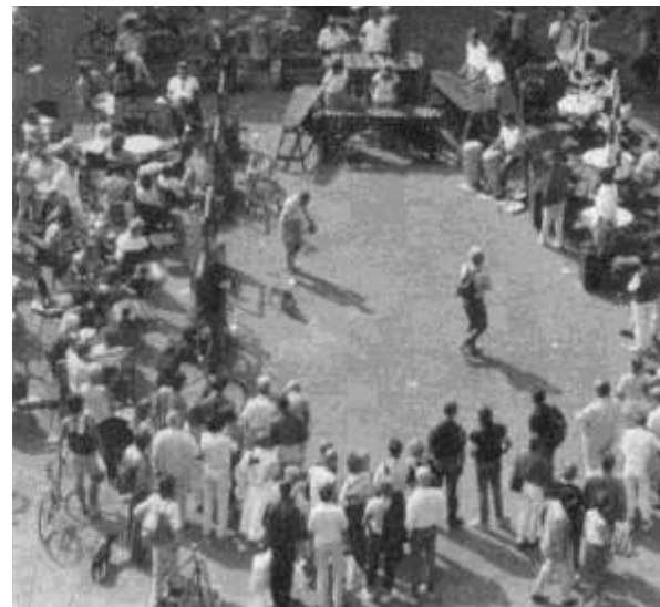
تصویر (11) - رویدادهای غیررسمی بهانه‌ای برای تجمع

میدان شهری، برای شهروندان و تبلور زندگی جمعی آنهاست، و باید پاسخگوی نیاز زندگی اجتماعی و جمعی آنها در مقیاسی بالاتر از حد محلات باشند. در این نوع میداين، شهروندان بدون آنکه یکدیگر را بشناسند و یا حضور آنها مقید به روابط محیط زندگی شان باشد با همدیگر برخوردهای اجتماعی چهره به چهره دارند، و بهمین دلیل نحوه حضور و رفتارهای آنها بسیار متنوع‌تر و راحت‌تر از سایر میداين می‌باشد. تصویر ذهنی شهروندان از این نوع میداين و مقیاس آنها به گونه‌ای است که توقع فضایی عام‌تر، متنوع و پر از رویداد را دارند.