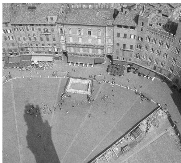
تصویر (14) - پیاده عامل هویت و شخصیت میدان

این کرانه‌ها می‌توانند صلب یا نرم باشند. کرانه‌های صلب همان بدنه‌های ساختمانهای اطراف میدان، می‌باشند و کرانه‌های نرم می‌توانند با پوشش گیاهی، ردیف درختان