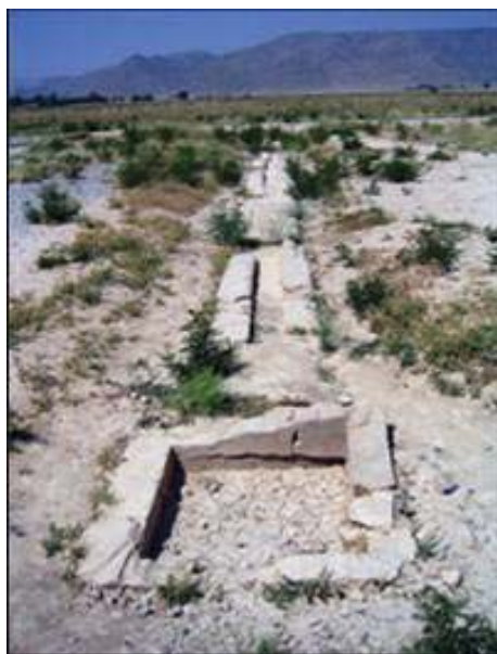
شکل ۱. آب راه پاسارگاد ( مأخذ: سمیع آذر، ۱۳۸۶)

قرار گیری در اقلیم گرم و خشک همواره موجب اهمیت ساخت باغ‌هایی بوده که همچون نماد و متذکر بهشت اخروی باعث آسایش و آرامش مردمان این خطه شده است. بنابراین یکی از مهمترین عناصر معماری و شهر سازی ایران را می‌توان باغ‌های آن دانست که با تنوع جهت استفاده اقشار مختلف و در طول سالیان طولانی بدست معماران چیره دست این مرز و بوم ساخته شده و بعنوان یکی از بارزترین یادگارهای