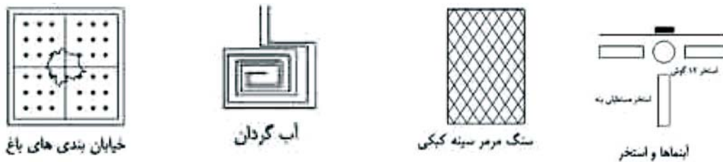
شکل ۳. اجزاء و جزئیات باغ (مأخذ: پیرنیا، ۱۳۷۳)