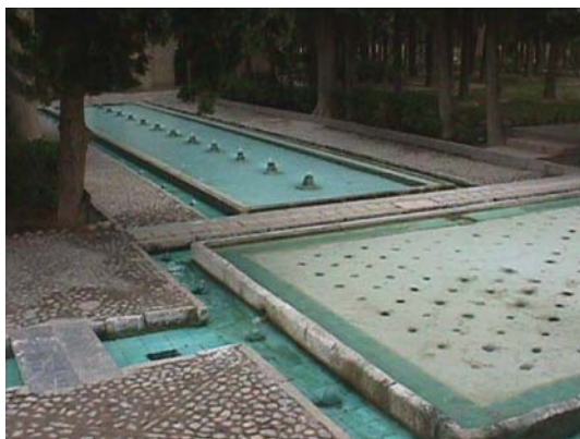
شکل ۲. تقسیم چهار- باغ فین کاشان

از هنگام غلبه اعراب بر ایرانیان در سراسر سده های اسلامی تاکنون، باغ های این کشور در نظر مردم آن نمونه بهشت موعود بوده اند. بی شک علت بوجود آمدن این عقیده در بین آن ها و ارزش زیادی که برای باغ ها قائل هستند، خشکی و بی درختی فلات ایران است. اصل و منشأ جنبه حیات بخش باغ ها به ادوار ابتدایی باز می گردد. از چهار هزار سال پیش از میلاد هنگامی که شکارچیان از کوه ها سرازیر می شدند و در دره های طویل فلات بزرگ ایران به کار کشاورزی می پرداختند، جنبه های مختلف زندگی و معتقدات خود را بر روی اشیای