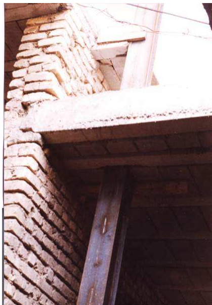
تصویر ۱: تصویری از وضع موجود. عبور ستون از سقف بدون وجود پل باربر. در زیرزمین ستون از داخل بلوک بین دو تیرچه متوالی گذشته و در تراز بعدی تیرچه سقف پارکینگ مستقیماً به ستون تماس یافته است.

این ساختمان مسکونی نیم‌ساز که حدود ۱۴ سال پیش در شهر یزد مورد بررسی برای مقاوم‌سازی قرار گرفت [۳]، از نوع مصالح بنائی با یک قاب میانی بود که فقط در حد سقف زیرزمین و پارکینگ انجام و قسمتی از دیوارهای همکف نیز بنا شده بود. همچنین یک ردیف ستون فلزی که در درون دیوار زیرزمین جای گرفته بودند، بدون وجود هیچگونه تیری در تراز سقف، از درون سقف تیرچه بلوک عبور داده شده و در طبقه فوقانی امتداد یافته بودند. تصویر (۱) گوشه‌های از وضعیت موجود را نشان می‌دهد.