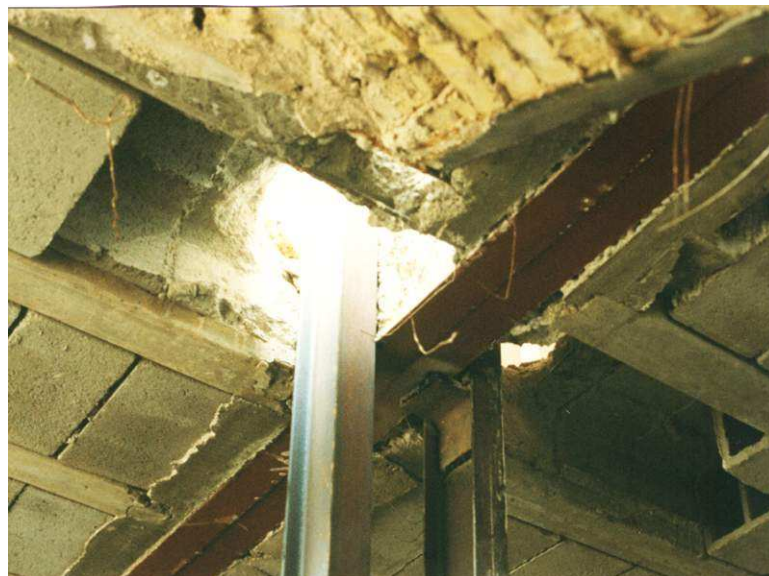
تصویر ۵: نصب موقت ستون‌های قاب خورجینی معکوس

قطعات ستون از طرفین پل و سوراخ کردن سقف در این مواضع نموده، سپس قطعات ستون را، تک تک در طرفین پل، از سوراخ‌های سقف عبور داده، در محل خویش مستقر نموده، بر روی کف ستون مربوطه نصب می‌نمائیم (تصویر ۵).