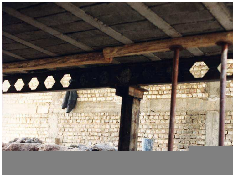
تصویر ۲: تیر سرتاسری بر روی نشیمن نصب شده است.

۳-۱-۲- در بسیاری از موارد مشابه که سازه دارای قاب فولادی است و نیاز به تقویت دارد، استفاده از سیستم خورجینی و نیمه خورجینی، قابل توصیه تلقی می‌گردد.