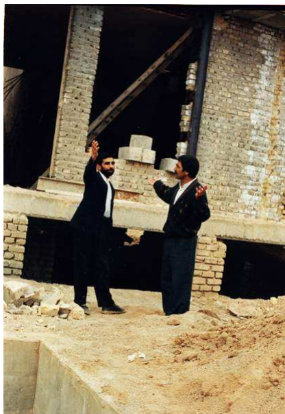
تصویر ۳: تصویری از نمای ساختمان پس از نصب ستون با سیستم خورجینی معکوس. همچنانکه در تصویر معلوم است دیوار باربر آجری بر روی سقف تیرچه بلوک با دهانه زیاد قرار داشته است.

راه حل معقول تری که به ندرت برگزیده می شود، استقرار ستون یا ستون های میانی ممتد در طبقات است. در اجرا برای عملی شدن این گزینه، لازم است پس از شمع بندی مطلوب طبقات برای انتقال بار سقف ها به زمین و آزادسازی دیوار و پل های باربر موجود، با تخریب موضعی دیوار، کندن سقف در محدوده های مورد نظر برای عبور ستون یا ستون های جدید و بریدن پل های فولادی در این مواضع، ستون های مورد نظر را در محل خویش استقرار داده، با نصب نشیمن های مناسب در زیر آنها (تحت فشار)، مسیر بار به این ستون ها هدایت می گردد و سپس شمع ها را برمی دارند.